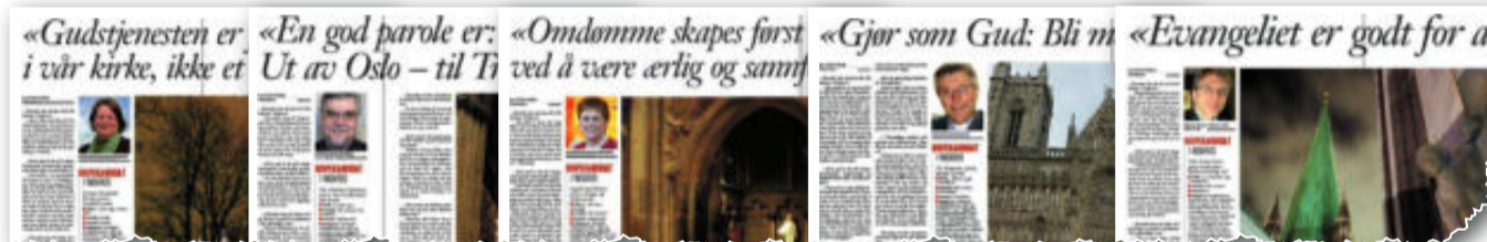
Vårt Land 22.01.08