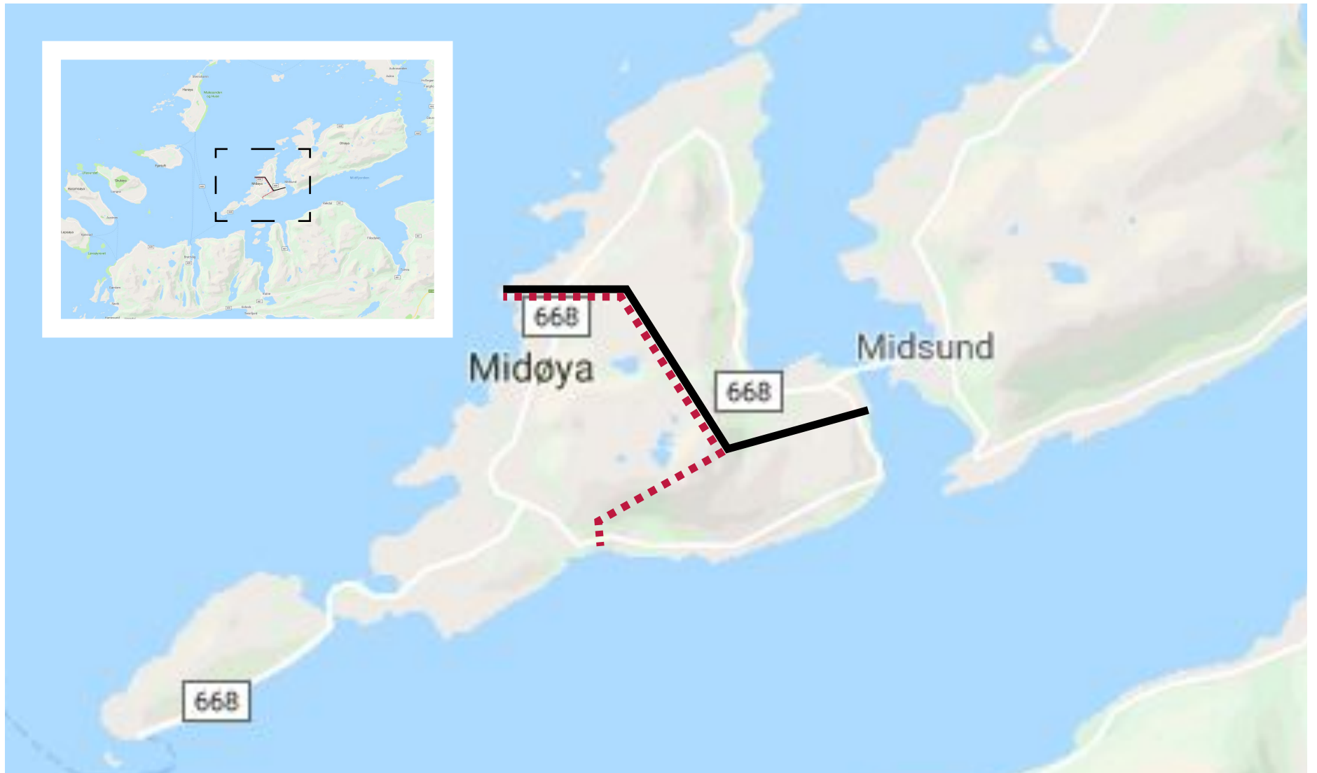
— Riksgrense mellom Danmark/Norge og Sverige 1658-1660 og soknegrense mellom Aukra og Vatne 1622-1792. - - - - - Fogderigrensa mellom Romsdal og Sunnmøre fram til 1965.

Midt-Norge gjenerobret militært av nordmennene. Ved freden i København i 1660 ble tilbakeføringen av landområdene formelt stadfestet.