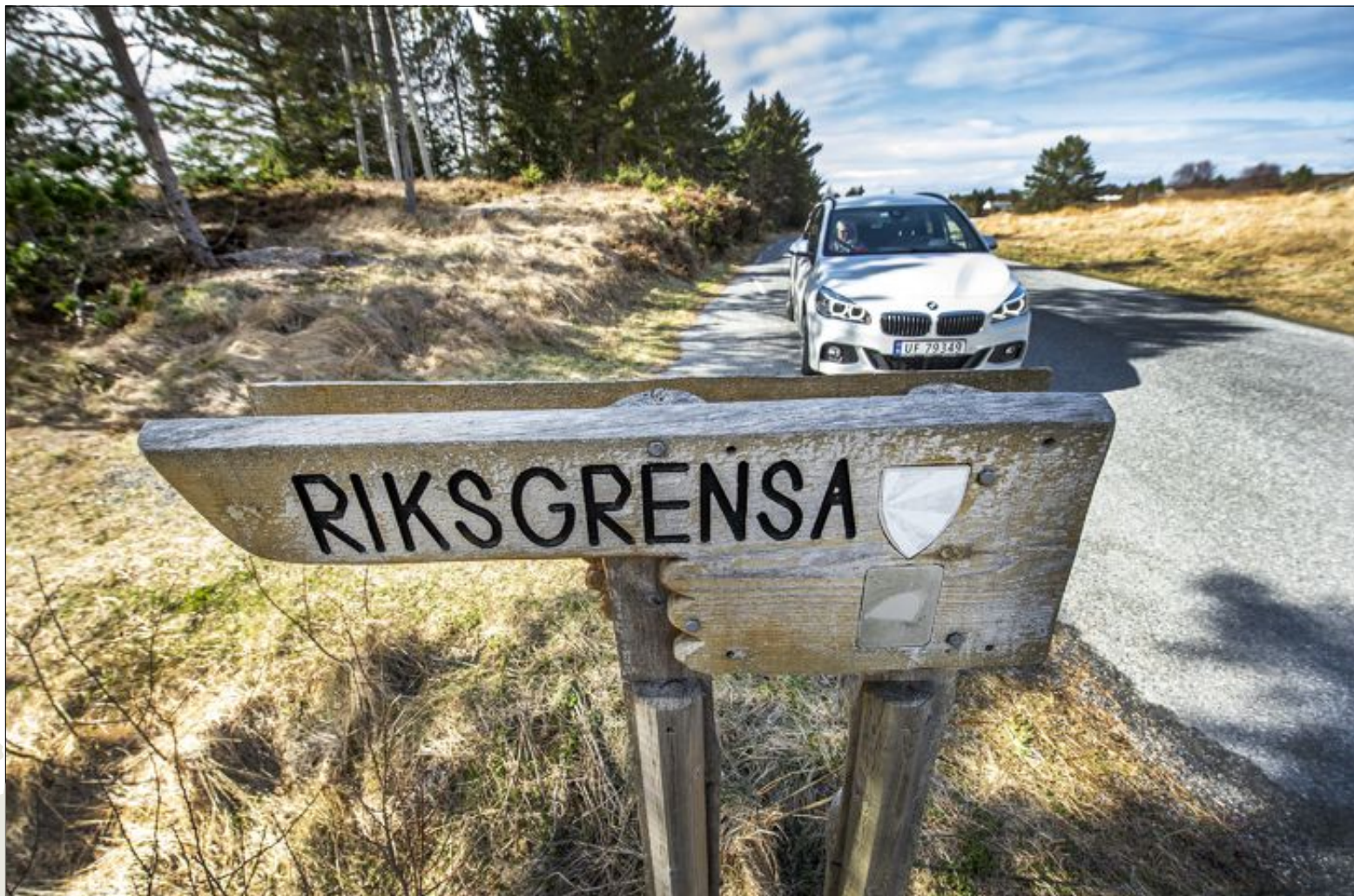
HARØYA: Også Harøya, som i dag tilhører Sandøy kommune og skal bli del av nye Ålesund, har i uminnelige tider vært delt mellom fogderiene Sunnmøre og Romsdal. Her et bilde fra der riksgrensa gikk over Harøya i 1658-1660, da Midt-Norge lå under Sverige.