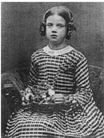
Darwin ble knust da hans eldste datter Annie døde i 1851, ti år gammel. På dette tidspunktet var hans kristne tro svekket og han hadde sluttet å gå i kirken.