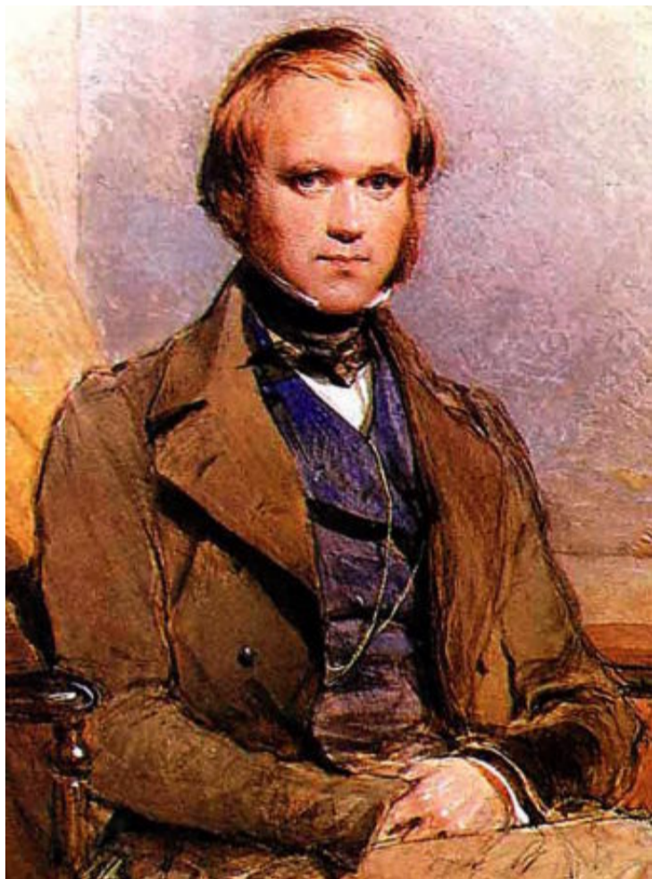
En ung Charles Darwin malt av George Richmond på slutten av 1830-tallet. Da var Darwin nærmere 40 år.

gsbøker om CHARLES DARWIN i hans jubileumsår. andre veien og gitt ut to Darwin-kritiske bøker.