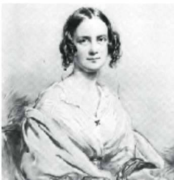
Darwin giftet seg med sin kusine Emma Wedgwood.